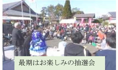
最期はお楽しみの抽選会