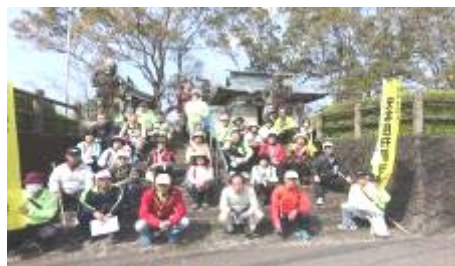
黒坂観音前で はいパチリ