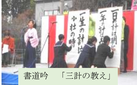
書道吟「三計の教え」