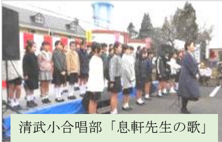
清武小合唱部「息軒先生の歌」

今年も出演団体、出店関連、ボランティア関連等々、たくさんの皆様にあたたかいご支援を頂戴し、2000名以上のご来場の皆様で終日大盛況でした。心よりお礼を申し上げます。