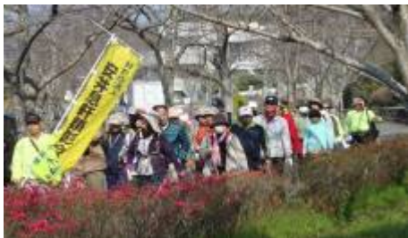
いざ行かん 飴肥街道!