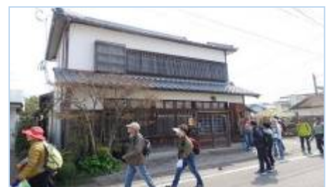
新町の商家街を歩く

3月17日(日)、本年度第2回目の息軒ウォークを開催。本来は3月10日(日)に開催の予定でしたが、その日に限って雨で1週間延長しました。今回の息軒ウォークは「早春の飴肥街道を歩く」と銘打ったところ、当初から申込みが殺到。早々と定員の30名を超え、50名に達する勢いだったため、1ヶ月前には受付を締め切らせていただきました。誠に申し訳ありませんでした。