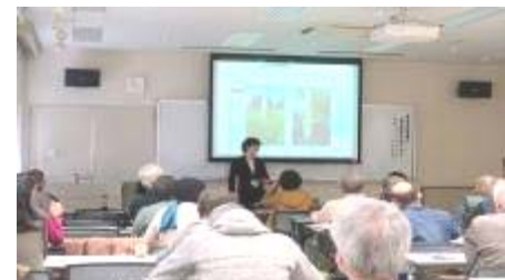
「自由民権運動と安井息軒の弟子たち」